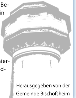
Herausgegeben von der Gemeinde Bischofsheim

Die Gemeindeverwaltung Bischofsheim teilt mit, dass am Mittwoch, 02.11.2022, Verwaltung und Feuerwehr eine gemeinsame Übung durchführen. Simuliert werden ein Stromausfall und die Wiederherstellung der Stromversorgung mit einem Notstromaggregat. Aus diesem Grund sind die Rathäuser, der Bürgerservice und Außenstellen, wie der Bauhof, an diesem Tag von 8 bis 12 Uhr nur eingeschränkt telefonisch erreichbar. Da die Server der Gemeinde heruntergefahren werden müssen, ist auch die Arbeit am PC nicht möglich. Deshalb werden für diesen Tag keine Besuchstermine in den Rathäusern und mit dem Bürgerservice vereinbart. Die Gemeindeverwaltung bittet hierfür um Verständnis.