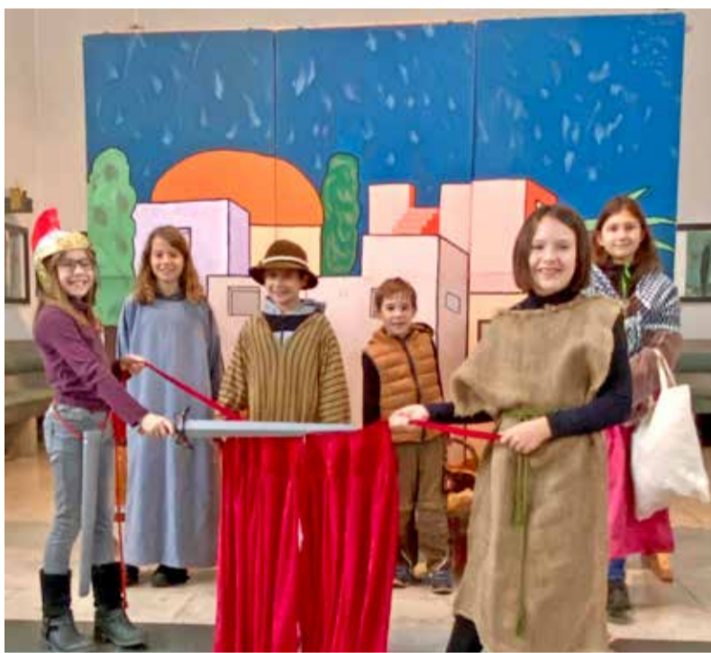
Aufnahme bei der diesjährigen Martinsspielprobe in Ginsheim.

Am Donnerstag, 10.11., um 17.30 Uhr, laden die Kirchengemeinden Gustavsburg zusammen mit dem FC Germania 05 Gustavsburg zum Martinsumzug ein. Der Martinszug startet um 17.30 Uhr auf dem REWE-Parkplatz (Richtung Feuerwehr) mit einer kurzen Hinführung zu St. Martin, seinem Leben und seiner Botschaft. Der Zugweg geht ein Stück parallel zum Damm, dann unter der Mainbrücke hindurch und endet am Sportplatz. Begleitet wird der Martinszug von der Jugendfeuerwehr mit Fackeln und einem St. Martin auf dem Pferd. Auf dem Sportplatz werden Martinsbrezel verteilt.