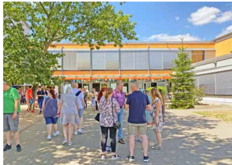
Die IGS-Mainspitze bei ihrem 50. Jubiläum im Juni 2022

förderung Ginsheim-Gustavsburg im Jahr 2012. Aufgrund des Erfolges setzten Schule und Stadtverwaltung ihre Zusammenarbeit fort und gewannen die Gemeinde und den