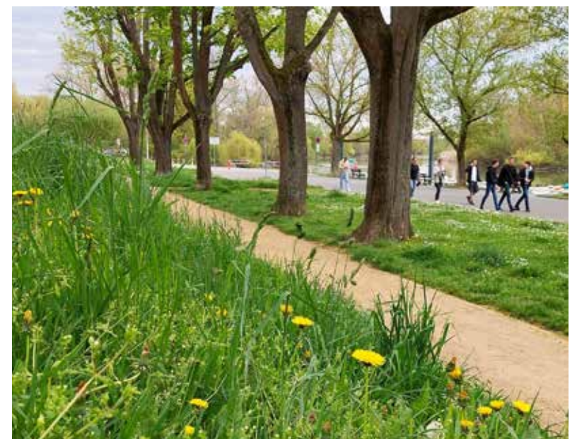
Mehr Natur wagen: Nach Meinung der Altrhein-Initiative sollte nicht nur der Bewuchs des Damms, sondern auch der gesamte Uferbereich naturnaher gestaltet werden.

Die Stadt Ginsheim-Gustavsburg kündigte an, dass sie einen Beteiligungsprozess mit fachlicher Begleitung zur Neugestaltung des Uferbereichs starten wird. Die Altrhein-Initiative begrüßt, dass die Planung in die nächste Runde geht und sagt: „Aus unserer Sicht muss die Neugestaltung des Altrheinufers in Richtung eines naturnahen Bereichs entwickelt werden. Ideen, wie zum Beispiel ein fest installierter Imbiss- oder Weinstand, sehen wir bezüglich der bestehenden Lokalitäten und vor allem wegen des Naturschutzes kritisch.“ Die Initiative weist darauf hin, dass der Ginsheimer Altrhein – inklusive seiner Uferbereiche – Flora-Fauna-Habitat ist und zusammen mit Langenau und Neuau zu einem bedeutenden