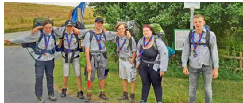
Das Foto entstand vor zwei Jahren während der Fahrt der Gruppe der Luchse nach Norddeutschland. Viele von ihnen engagieren sich heute als Gruppenleiter:innen

Deshalb finden vom 18. bis 21.05. im „Bansen“ am Altrhein die Jubiläumsfeierlichkeiten statt. 25 Jahre gab es zunächst die CPD (Christliche Pfadfinderschaft Deutschlands) sowie die EMP (Evangelische Mädchenpfadfinder), die dann vor 50 Jahren auf Landesebene fusionierten und im VCP (Verband Christlicher Pfadfinderinnen und Pfadfinderinnen) aufgingen.