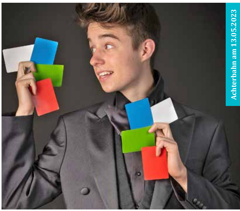
Achterbahn am 13.05.2023