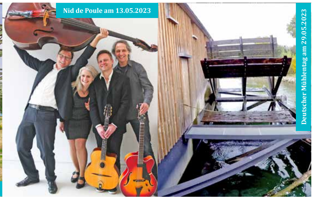
Nid de Poule am 13.05.2023