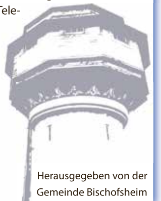
Herausgegeben von der Gemeinde Bischofsheim