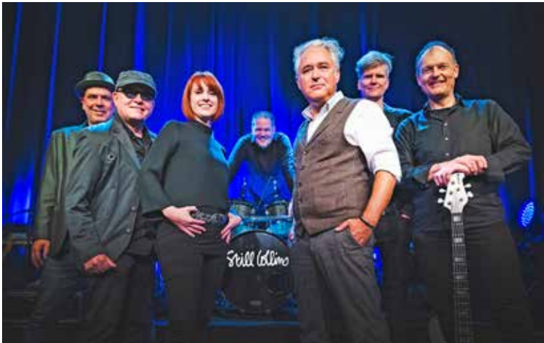
Still Collins – The Very Best of Phil Collins & Genesis