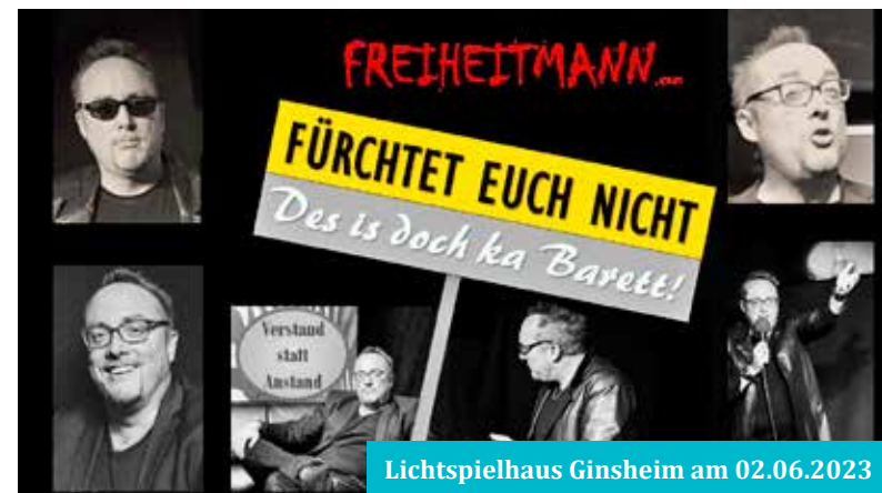
Lichtspielhaus Ginsheim am 02.06.2023

ab 18 Uhr » Ochsenwiese Burgfest Gustavsburg | www.burgfest-gustavsburg.de