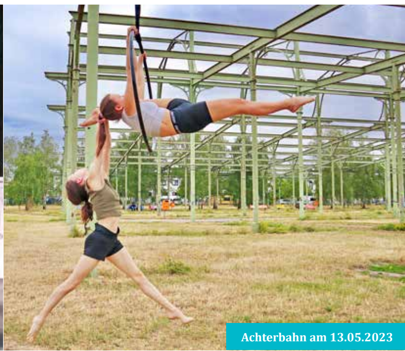
Achterbahn am 13.05.2023