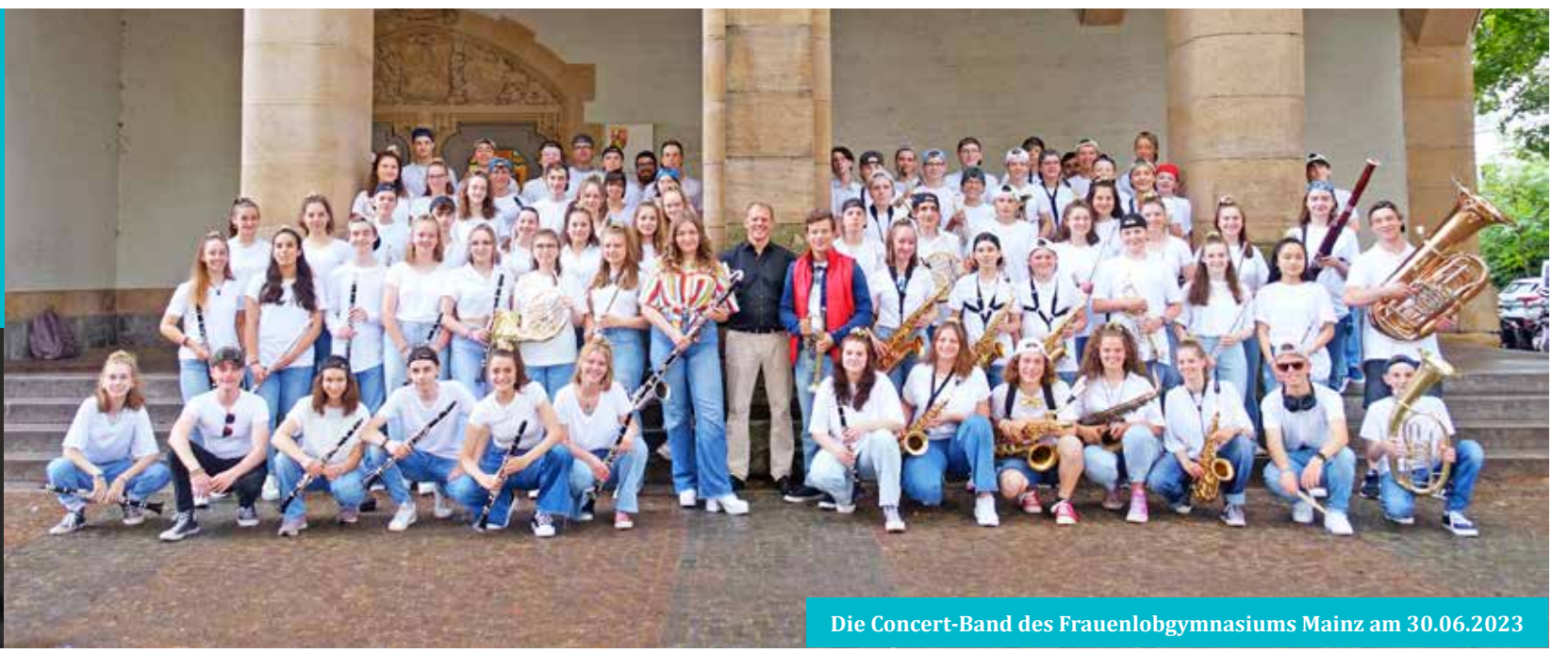
Die Concert-Band des Frauenlobgymnasiums Mainz am 30.06.2023