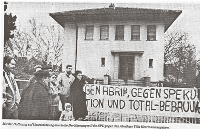
Mit der Hoffnung auf Unterstützung durch die Bevölkerung will die SPD gegen den Abriss der Villa Herrmann angehen.

Gustavsburg 4 und die CDU beantragt den Aufkauf des Hauses durch die Gemeinde zur Abriss-Verhinderung 5 . Unterschriftensammlung der SPD, Ortsbesichtigung des Bau- Umwelt- und Verkehrsausschusses und nichtöffentliche Sitzung der Gemeindevertretung im März 1988 führen zum Kaufvertrag mit der Gemeinde und Übergabe am 6. Mai 1988 6 . Ein Jahr später zieht die Volkshochschule in das Erdgeschoß, im Obergeschoß gibt es Büroräume. Im Dachgeschoß wird eine Wohnung eingerichtet. 1991 kommen Kulturamt und Jugendpflege, 1992 die Gemeindebücherei und 1994 die Musikschule ins Haus. 1998 findet auf dem Grundstück erstmals ein Open Air Kino statt, weicht die Gemeinde mit mehreren hundert Gästen den Generationentreff ein und hält der neue Arbeitskreis für Kinder und Jugendliche eine erste Sprechstunde ab. Im Folgejahr beginnt Kultur im Sommer mit dem Film „Verrückt nach Mary“.