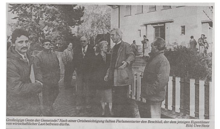
Großzügige Geste der Gemeinde? Nach einer Ortsbesichtigung fallen Parlamentarier den Beschluss, der dem jetzigen Eigentümer von wirtschaftlicher Last befreien dürfen.

Hierzu erwirbt die Gemeinde ein gebrauchtes, in einem Bauwagen installiertes Vorführgerät. Zum Abschluss des Kultursommers hält der evangelische Bläserchor bei strömendem Regen eine öffentliche Probe vor vierzig unentwegten Gästen. Während 1999 die VHS auszieht und 2000 die Bücherei geschlossen wird, werden 2001 die bislang im Bürgerhaus Ginsheim und beim ASB in Gustavsburg befindlichen Sozialstation der Gemeinde, das Pflegepersonal, beide Verwaltungsangestellten und der Zivildienstleistende in der Villa Herrmann zusammengefasst. 2002 feiern die CDU ihr Sommerfest, die SPD das Kuchbachtfest und der Gesangverein Einigkeit beginnt erstmals ein Singen in den Mai. Der Bereich Öffentlichkeitsarbeit zieht 2003 aus dem Haus aus, der Historiker