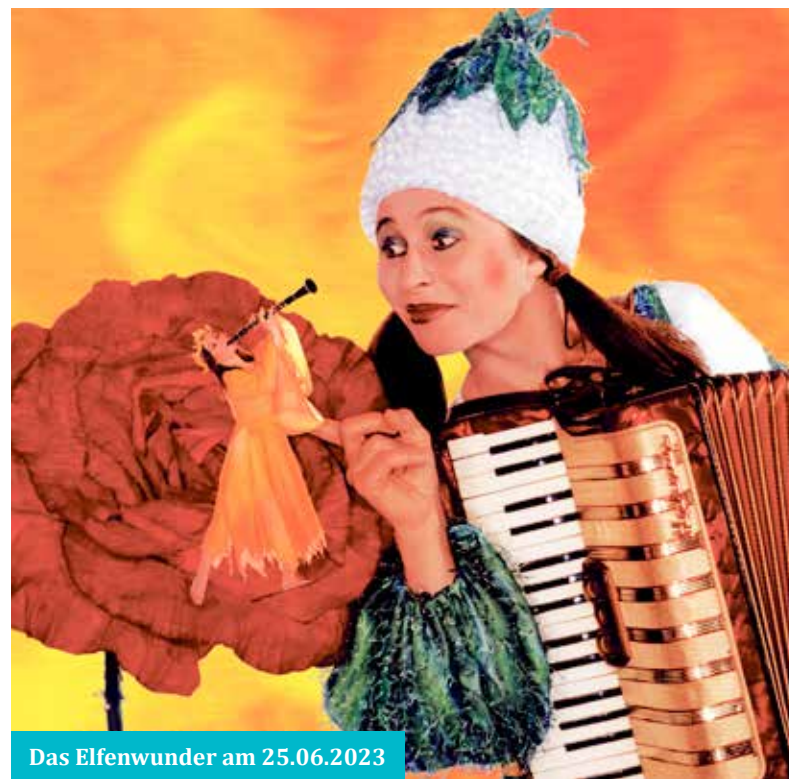
Das Elfenwunder am 25.06.2023

15 Uhr » Seniorentreff Zur Fähre Ginsheim Der VDK GiGu lädt ein: Vortrag zu Rententhemen Um Voranmeldung