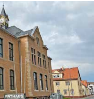
Im Ginsheimer Rathaus können derzeit 37 Mitarbeiter gleichzeitig arbeiten.

stylistischen Cafés ausstrahlt und nicht an ein Büro erinnert. Fairerweise sei erwähnt, dass die Kreisverwaltung in den letzten Jahren stetig wuchs. Zurück nach GiGu: Vieles, was die Mitarbeiter der Stadtverwaltung für die Menschen in Ginsheim-Gustavsburg leisten, lebt vom persönlichen Kontakt. Kindergarten per Videokon-