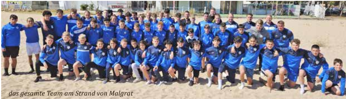
das gesamte Team am Strand von Malgrat

VfB Ginsheim – Rund 65 Spieler und Betreuer repräsentierten die Jugendabteilung des VfB beim internationalen Fußballturnier „CopaCostaBrava“ im spanischen Malgrat, nahe Lloret de Mar an der Mittelmeerküste der Costa Brava. Die Nachwuchskicker vom Altrhein spielten mit den U13-, U15- und U16/U17-Junioren gegen Teams aus