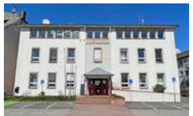
32 Arbeitsplätze der Stadtverwaltung GiGu befinden sich im Gustavsburger Rathaus

weil bei den jungen Besuchern. Für das leibliche Wohl war wie immer bestens gesorgt. Das reichlich gespendete Kuchenbuffet war schnell ausverkauft und auch alle anderen Speisen fanden einen guten Absatz. Der Vorstand des ASV bedankt sich bei den Kuchenspendern und die tatkräftige Mithilfe der Aktiven. Die nächste große Veranstaltung ist das Sommerfest vom 18. bis 20.08. Zum erfolgreichen Gelingen werden auch hier wieder viele Helferinnen und Helfer benötigt. Save the date !!!