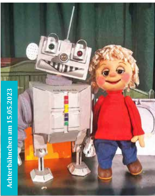
Achterbahn am 15.05.2023