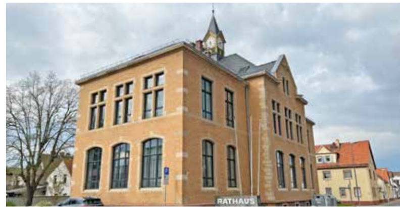
Im Ginsheimer Rathaus können derzeit 37 Mitarbeiter gleichzeitig arbeiten.

für zeitweilig im Home-Office beschäftigte Mitarbeitende vor. Während meiner Recherchen sitze ich an meinem Schreibtisch, trinke Tee aus meinem Lieblingsteeglas und überlege mir, wie es wäre, auf mein vertrautes Umfeld zu verzichten. Dabei fällt mir ein, dass ich häufig arbeite, ohne hier zu sein. Zwei aus meinem Team (beide unter 20) treffe